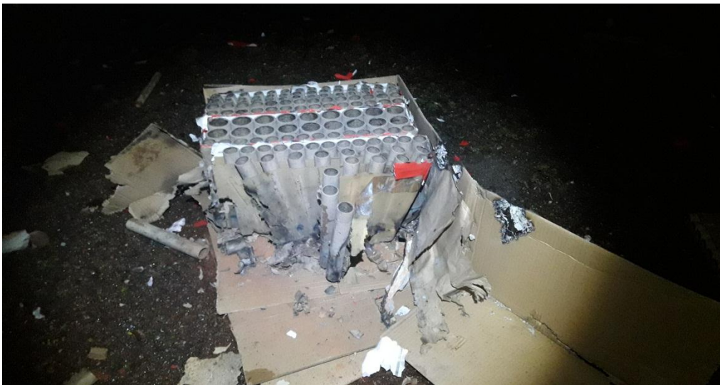
Havererad Tårta vid nyårsskjutning 2022

Vi bryter klockan 21 efter några timmar i terrängen.