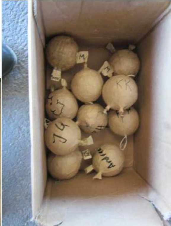
Tillverkning av 4" fyrverkeribomb